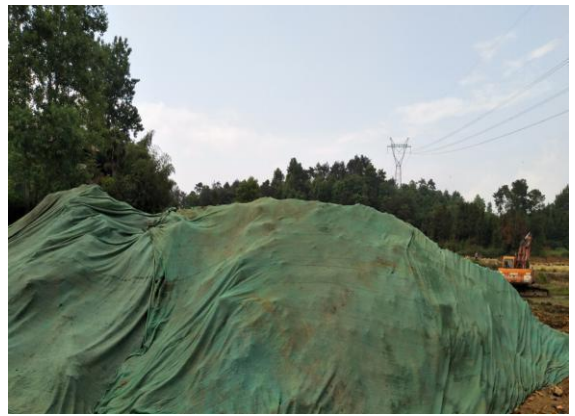
时堆土拦挡及苫盖