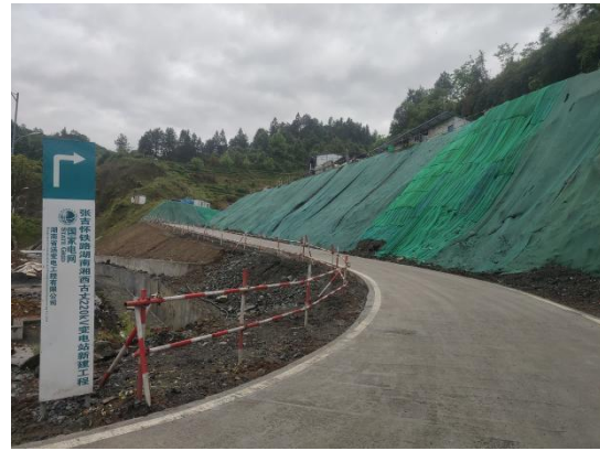
进站道路边坡临时覆盖