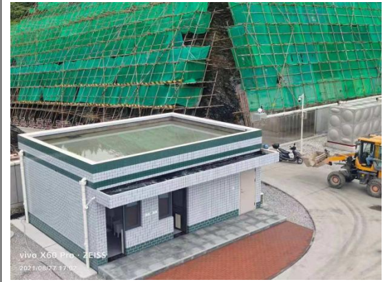
变电站外区边坡临时覆盖